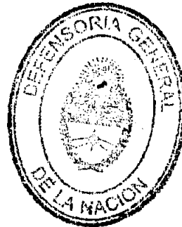
TERESITA SECO PON SECRETARIA DEFENSORIA GENERAL DE LA NACION