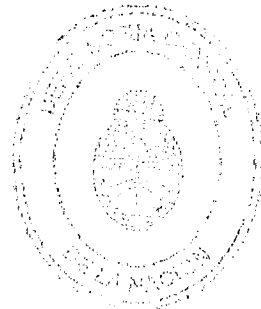
DIANA CAROLINA MARTÍNEZ PROCURADORA GENERAL DE LA NACIÓN