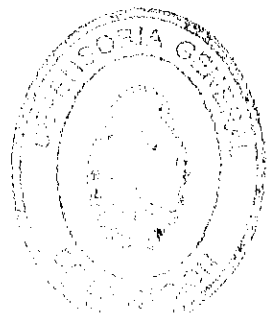
DRA. CATALINA MAZZEO PROFESIONISTA LEY 13.012 DEFENSORÍA GENERAL DE LA NACIÓN